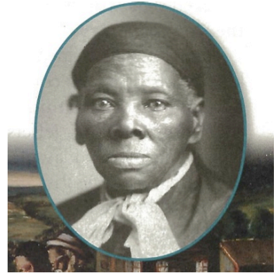
Harriet Tubman helped enslaved people escape through the Underground Railroad.

Tubman 後來成為“地下鐵路”(Underground Railroad)的領導人。“地下鐵路”並不是一條真正的鐵路，而是一群組成的第一個秘密團體，他們幫助被奴隸的人得到自由。Tubman 一共幫助大約三百個奴隸逃出美國。在她的保護下從來沒有被人抓到。